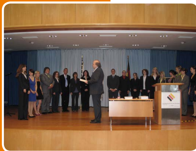
Diplomierungsfeier im Auditorium Maximum – Präsident Bönders übergibt die Diplomurkunden an die Absolventen/innen

Studierende des Studiengangs „Verwaltungsmanagement“ am Fachbereich Allgemeine Innere Verwaltung (FB AIV) setzen im Wechsel mit den berufspraktischen Studienabschnitten ihr