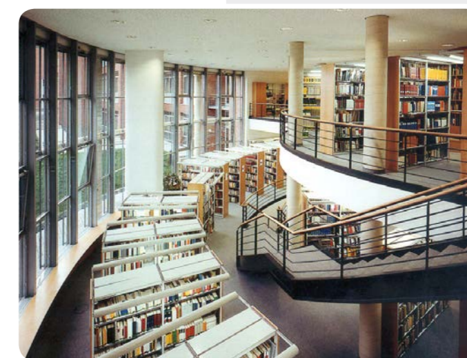
Bibliothek der Fachhochschule des Bundes, Brühl

Die Fachbereiche Auswärtige Angelegenheiten, Bundeswehrverwaltung, Finanzen, Landwirtschaftliche Sozialversicherung und Sozialversicherung führen das Grundstudium am Sitz des jeweiligen Fachbereichs durch. Das von den unterschiedlichen Anforderungen der jeweiligen Berufsfelder geprägte Hauptstudium der verschiedenen Fachrichtungen wird dezentral an den Fachbereichen durchgeführt.