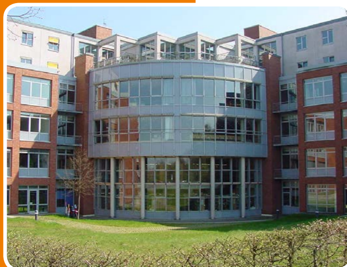
Blick auf die Bibliothek der Fachhochschule des Bundes, Brühl

Die vielschichtigen und interessanten öffentlichen Aufgaben in der allgemeinen und inneren Verwaltung der Bundesrepublik Deutschland werden zu einem wesentlichen Teil von Beamtinnen und Beamten des gehobenen Dienstes wahrgenommen. Sie arbeiten in den Behörden des Bundes, in Bundesinstituten und in den Bundesministerien mit großer Selbstständigkeit und eigener Verantwortung. Beamtinnen und Beamte des gehobenen Dienstes sind überwiegend als Sachbearbeiterinnen und Sachbearbeiter eingesetzt. Von ihnen wird die Fähigkeit verlangt, aufgrund eingehender Sach- und Rechtskenntnisse Gesetze, Verordnungen und Verwaltungsvorschriften zur Erfüllung der öffentlichen Aufgaben richtig und sinnvoll anzuwenden.